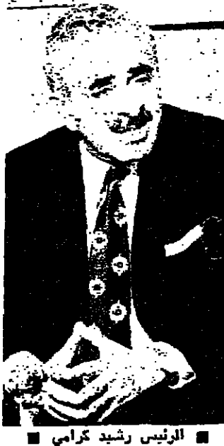
الرئيس رشيد كرامي

امضى الرئيس كرامي وقتاً طويلاً ظهر امس في وزارة الدفاع، مع قيادات الجيش العماد غانم وضباط القيادة، في متابعة تطورات الاعتداءات الاسرائيلية على لبنان، بعد استشهاد الضباط الاربعة في صور. وقد وصل الرئيس كرامي الى الوزارة في الساعة العاشرة حيث كان في استقباله قائد الجيش، وبعد على الفور اجتماع ضم كبار الضباط، جرى خلاله عرض تفصيل للاعتداء الاسرائيلي على صور، والقضايا المتعلقة لواجبه على صور في وزارة الدفاع، مجتمعاً مع قيادات الجيش العماد غانم وضباط القيادة، في متابعة تطورات الاعتداءات الاسرائيلية على لبنان، بعد استشهاد الضباط الاربعة في صور. وقد وصل الرئيس كرامي الى الوزارة في الساعة العاشرة حيث كان في استقباله قائد الجيش، وبعد على الفور اجتماع ضم كبار الضباط، جرى خلاله عرض تفصيل للاعتداء الاسرائيلي على صور، والقضايا المتعلقة لواجبه على صور في وزارة الدفاع، مجتمعاً مع قيادات الجيش العماد غانم وضباط القيادة، في متابعة تطورات الاعتداءات الاسرائيلية على لبنان، بعد استشهاد الضباط الاربعة في صور.